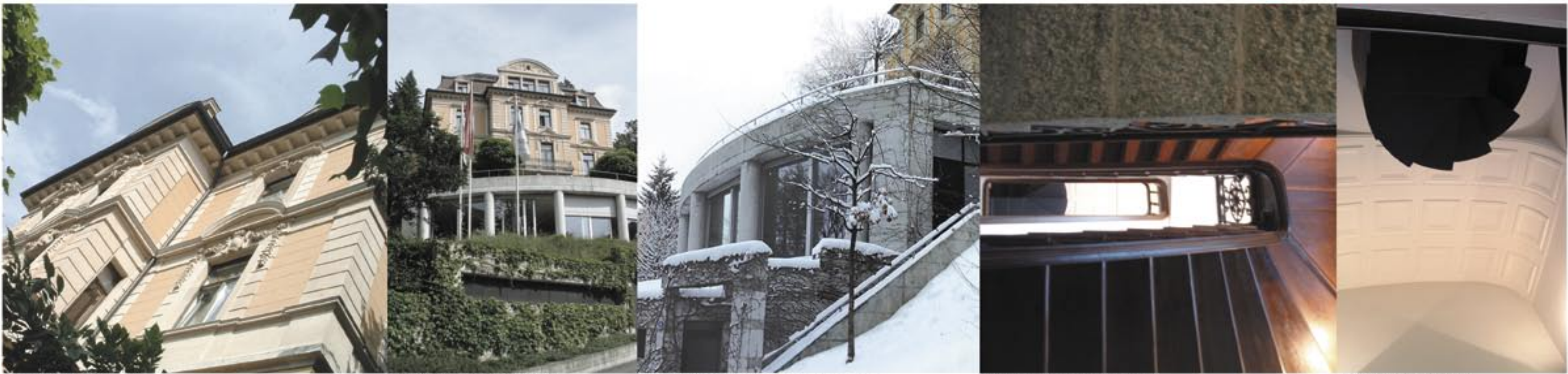
RESTAURATIONEN: der Fassaden INTERVENTIONEN: Terrassierten Bauwerk ERSCHLIESSUNGEN: Strasse > Garage > Neubau > Altbau ÜBERLAGERUNGEN: Treppenhaus untersicht KONFRONTATIONEN: untersicht