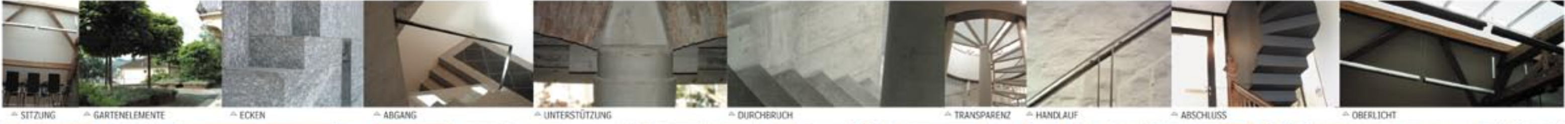
SITZUNG GARTENELEMENTE ECKEN ABGANG UNTERSTÜTZUNG DURCHERUCH TRANSPARENZ HANDLAUF ABSCHLUSS OBERLICHT