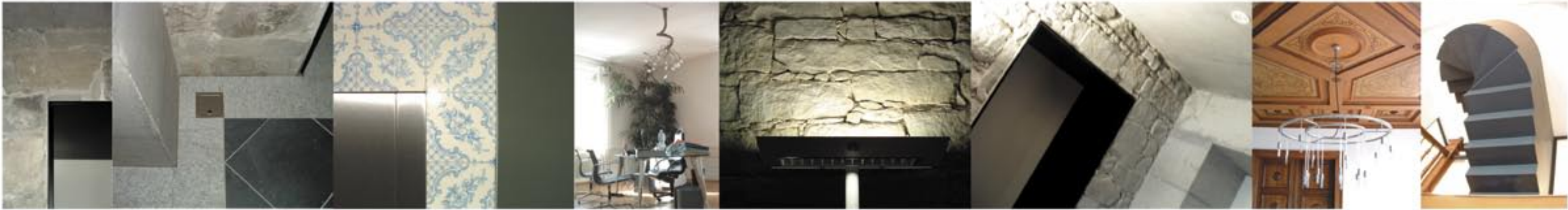
DURCHDRINGUNGEN: Türe COME TOGETHER: Ward/Böden Seifenspender /best.plättli/Spiegel RÄUMLICHKEITEN: Arbeitsplatz (Villa) BELEUCHTUNGEN: indirekt BELEUCHTUNGEN: direkt ENTDECKUNGEN: Restaurierte Decke VERBINDUNGEN: z. Dachgeschoss