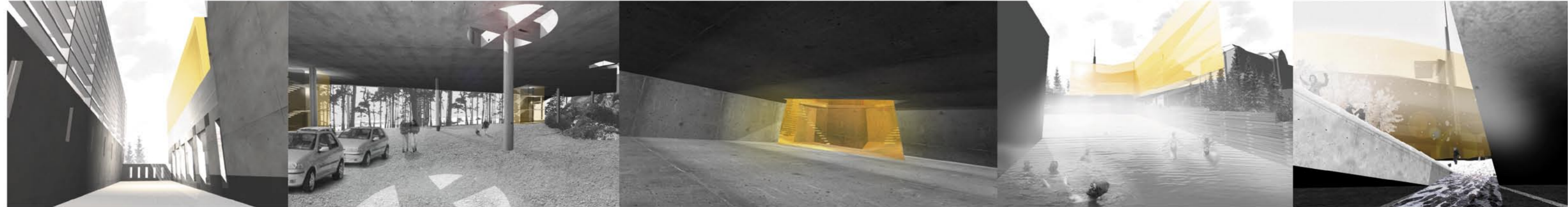
VERDICHTUNGEN: spannenden Räume zu schaffen