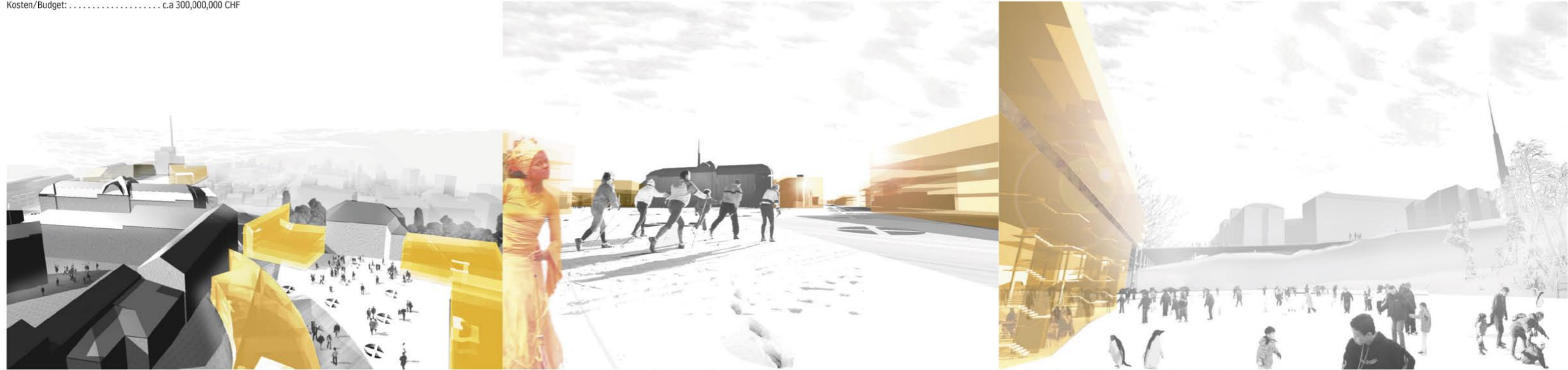
INTERAKTIONEN: Neubauten mit bestehenden Bauten